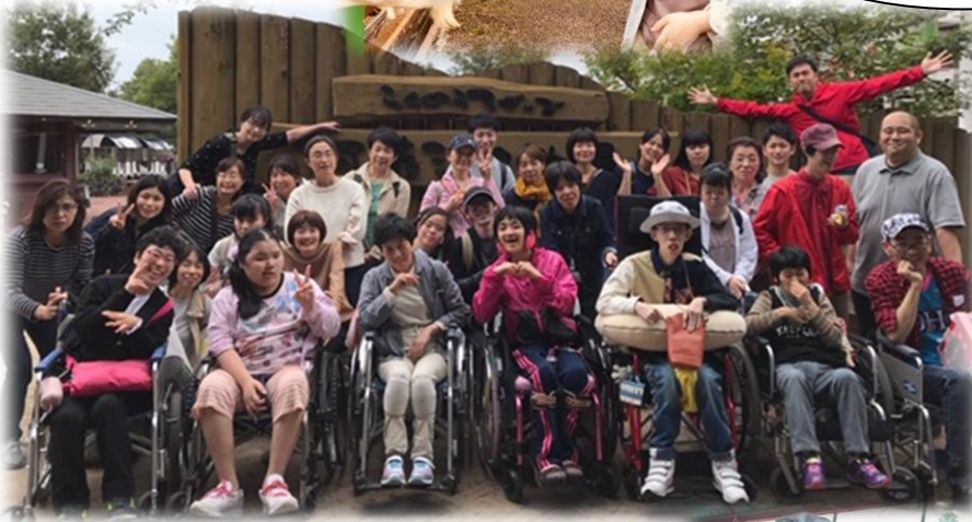
トラクターバスの乗ったよ!!