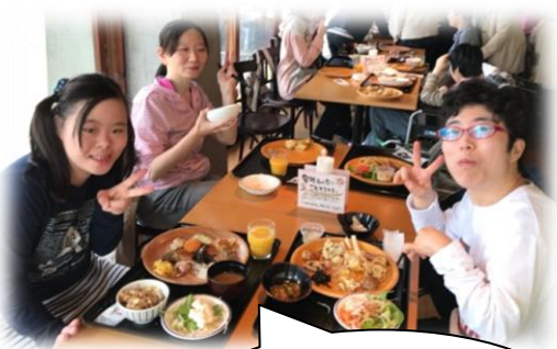
バイキング!! おいしかったよ~