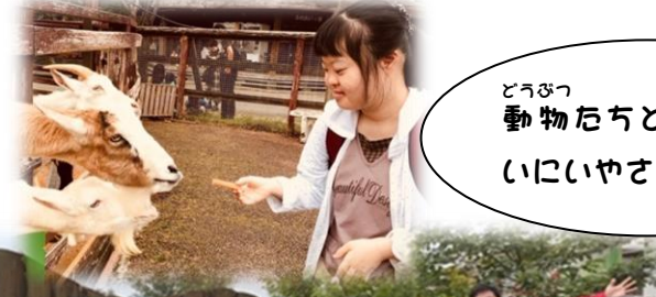
動物たちとのふれあいにいやされました