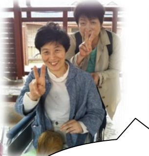
アイスの手作り体験☆ 楽しかったよ