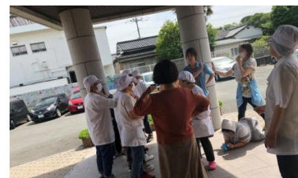
地震による防災訓練