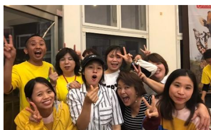
「ポレポレ祭り」×「ベトナム人」 ×「安武の子育て世代」